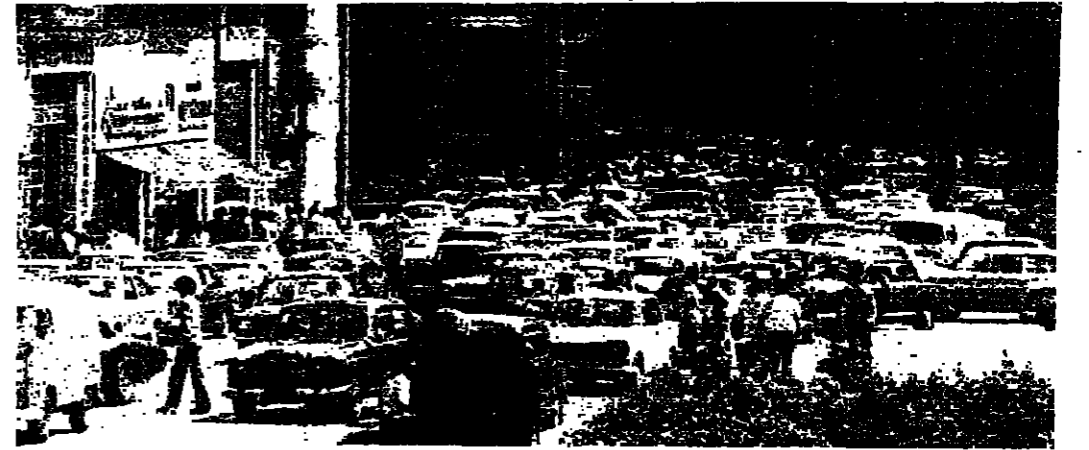
ساحله رياض الصلح كما يستصبح امس

المعرة و٢٥ دقيقة بين الشياح والرمانة ، واطلقت مضخة قوى الأمن النار على مسلحين توجهوا نحو شارع مسار مارون وحصنة في عين تروكيا ، فزودوا عليها مما اضطرها لطلب التوجه . وقد اصابت مضخة للدرك . وقعت اشتباكات في شارعسي بدارو وسماي الصلح بعد تقدم مسلحين اليها . وكذلك وقعت اشتباكات في التاصرة وبستان الحدت . وترددت روايات عدة عن حالات تسليم المطلوبين اليوم . وقد بدأ القصف بالخمسة في الساعة .